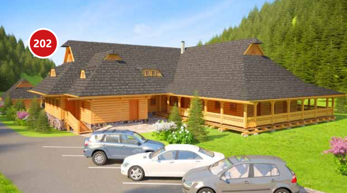
SO 202 – Technicko-obslužný objekt SO 203 – Viacúčelový objekt