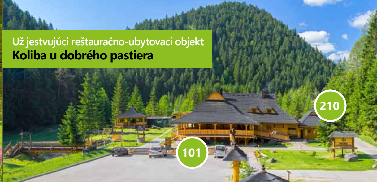
Už jestvujúci reštauračno-ubytovací objekt Koliba u dobrého pastiera